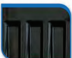
code 39 Black RAL 9005