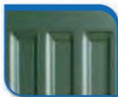
code 41 Alloy Green