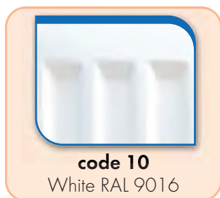
code 10 White RAL 9016