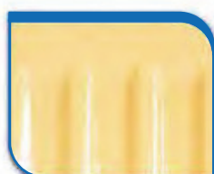
code 33 Vanilla