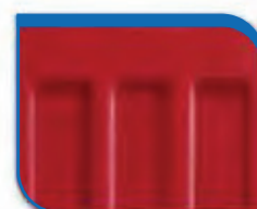
code 37 Red RAL 3001