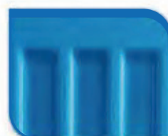
code 38 Blue RAL 5015