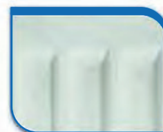
code 20 Ägäis