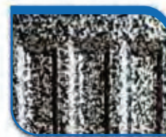
code 43 Pearl Silver