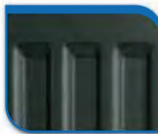
code 40 Alloy Black