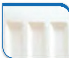
code 50 White RAL 9010