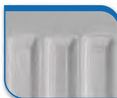
code 22 Manhattan