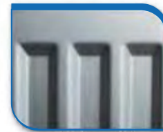
code 35 Silber