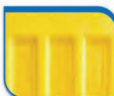
code 36 Yellow RAL 1018